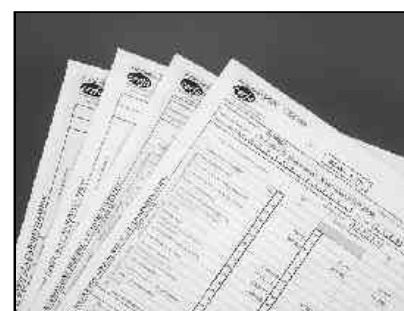
Impression laser de la liasse agréée par la DGI